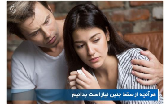
هر آنچه از سقط جنین نیاز است بدانیم

برای بارداری مجدد بهتر است مدتی صبر کنید تا بتوانید در آینده بارداری موفق داشته باشید زیرا بدن فرد برای بازسازی نیاز به زمان دارد و مدتی طول می کشد تا رحم خود را بازسازی کند و پوشش دیواره ی آن قوی و سالم شود.